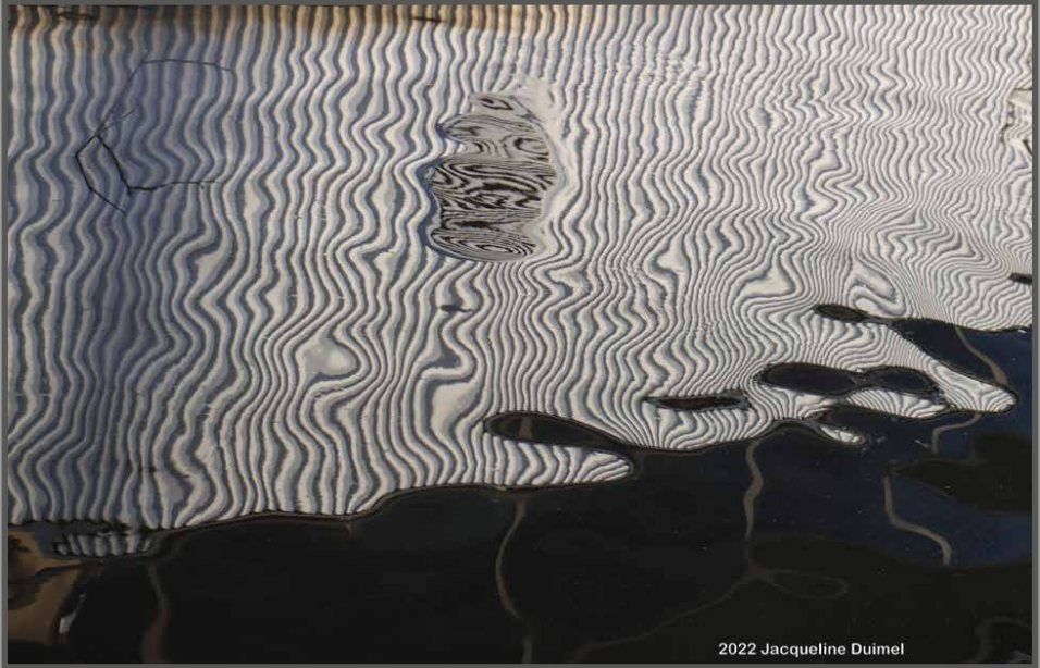
2022 Jacqueline Duimel

verschillende foto's ziet'. Ook het jaarlijkse Clubweekend is altijd heel gezellig. Allemaal mensen met een passie voor fotografie die proberen om iets mooi op de foto te krijgen. Jacqueline zelf houdt van foto's van reflecties, maar ook van architectuur of een landschap.